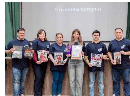
Квиз «Страницы истории», посвященный 80-летию Победы