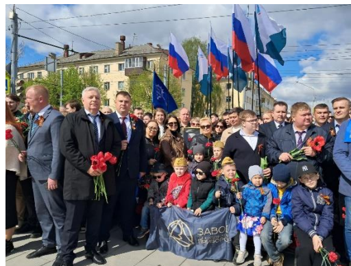
Празднование Дня Победы в Великой Отечественной войне