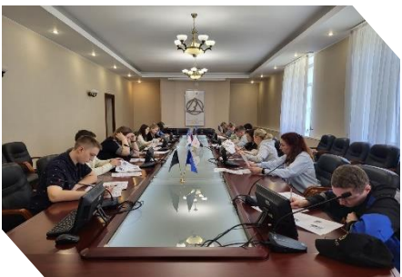
Международный исторический диктант на тему событий Великой Отечественной войны – «Диктант победы»