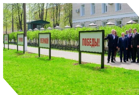
Открытие Аллеи истории Завода полупроводниковых приборов в сквере имени А.И. Владимирова