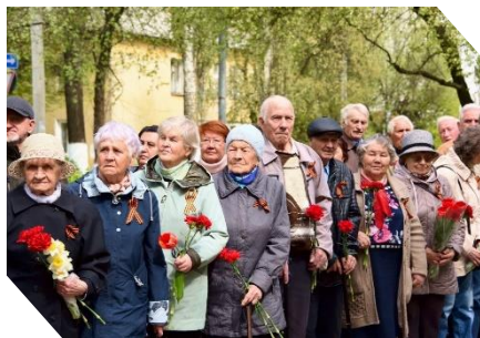
Торжественный митинг, посвященный 80-ой годовщине Победы в Великой Отечественной войне