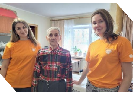
Волонтеры АО «ЗПП» навестили тружеников тыла и узников концлагерей, вручили им памятные подарки и цветы