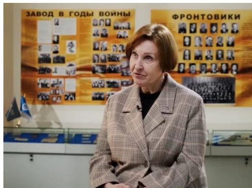
Семейная летопись Победы https://disk.yandex.ru/i/IKvojdC0m4UQWA