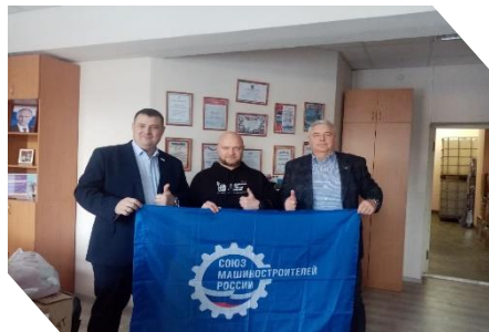
Передача гуманитарной помощи военнослужащим, находящимся в зоне проведения СВО

ЗАВОД ПОЛУПРОВОДНИКОВЫХ ПРИБОРОВ ЭЛЕМЕНТ