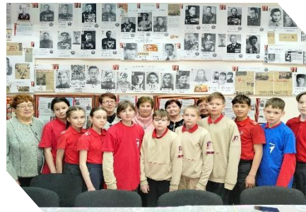
Диалоги о главном. Юнармейцы и ветераны завода: как прошлое встречается с будущим!