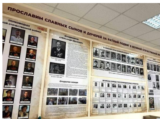
Реорганизация экспозиции в Совете ветеранов, посвященная памяти заводчан, героям войны, созданная на основе материалов заводской музейной коллекции