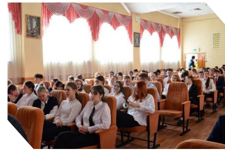
Международный исторический проект «Инженеры Победы»