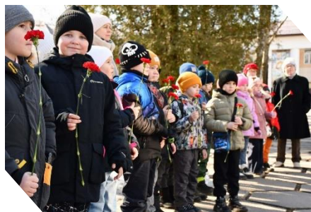
Акция «Сохраним память поколений». Совет ветеранов АО «ЗПП» провел беседу с «орлятами»-первоклассниками МБОУ СОШ №19 г