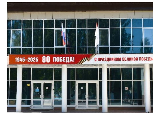
Участие во Всероссийском конкурсе «Весна Победы»