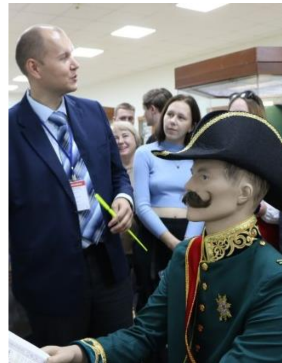
Манекен банковского служащего