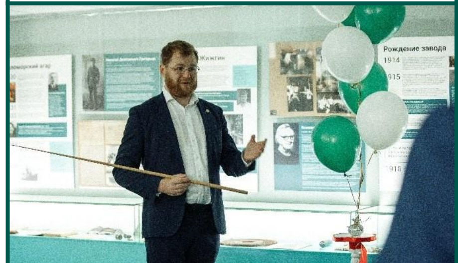
Экскурсию проводит гендиректор