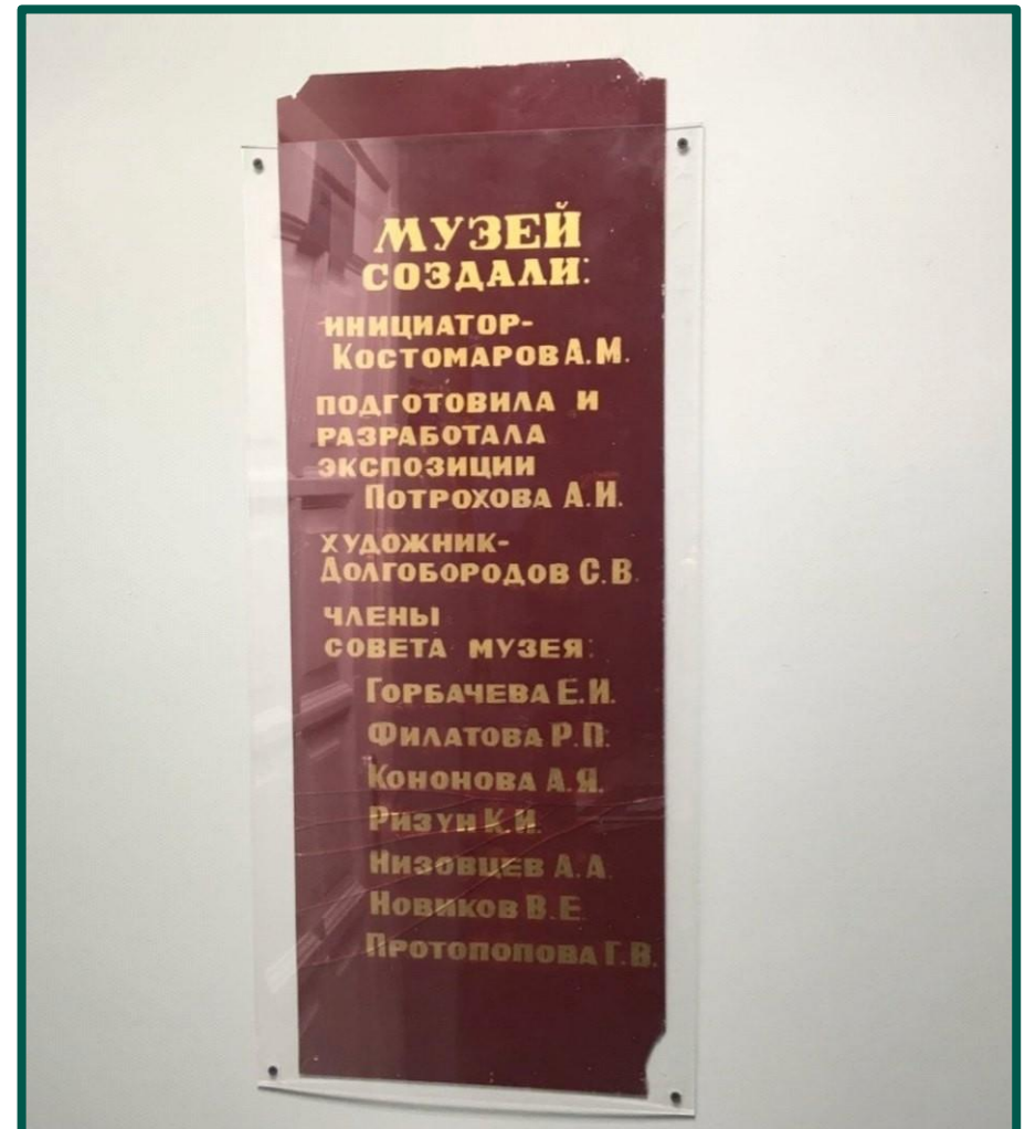
Памятная табличка, 1986 г.