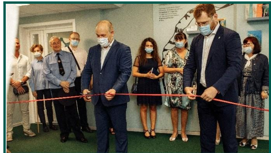
Открытие музея 14.07.2021 г.