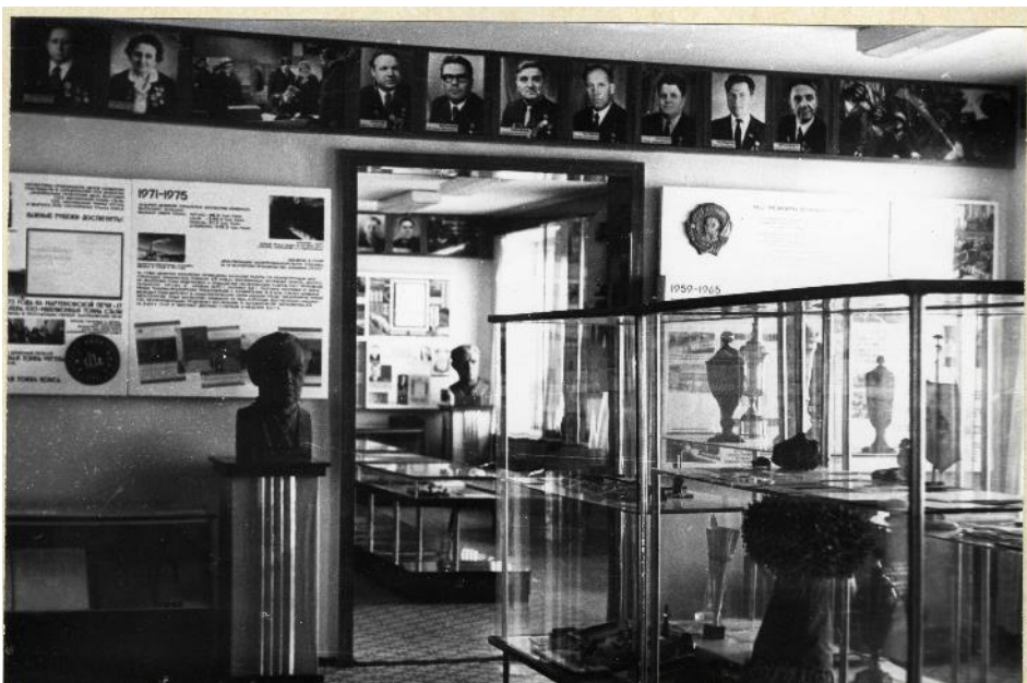
Фрагменты экспозиции музея истории в 1990-е гг.