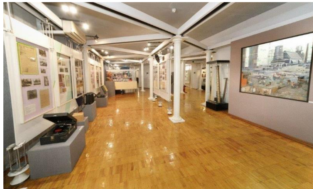
Фрагменты экспозиции музея истории в 2000-е гг