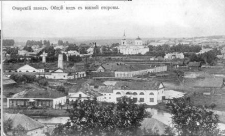
Очерский завод. Общий вид с южной стороны.

2021 год стал Юбилейным для Очерского машзавода, он отметил свое 260-летие