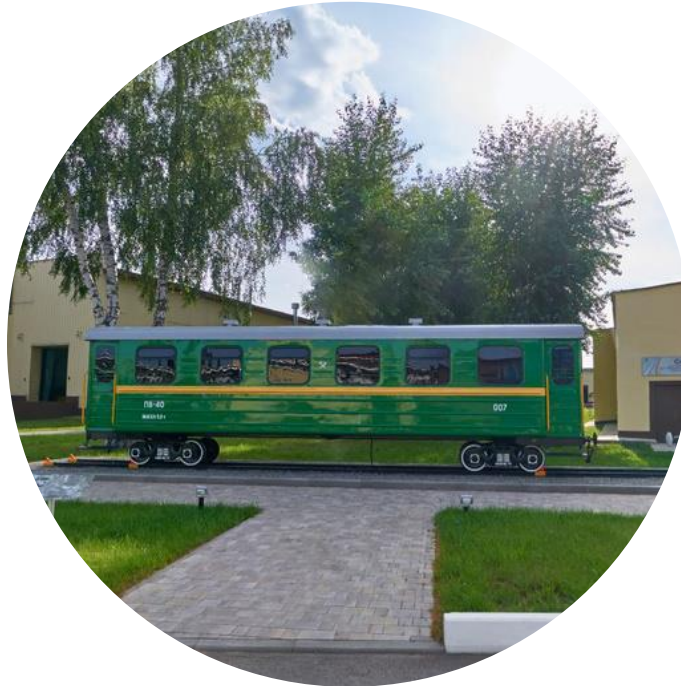
ПАССАЖИРСКИЙ ВАГОН ПВ-40