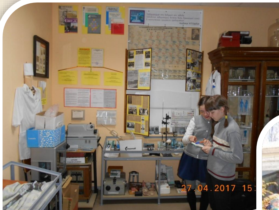
Знакомство с работой заводских лаборантов