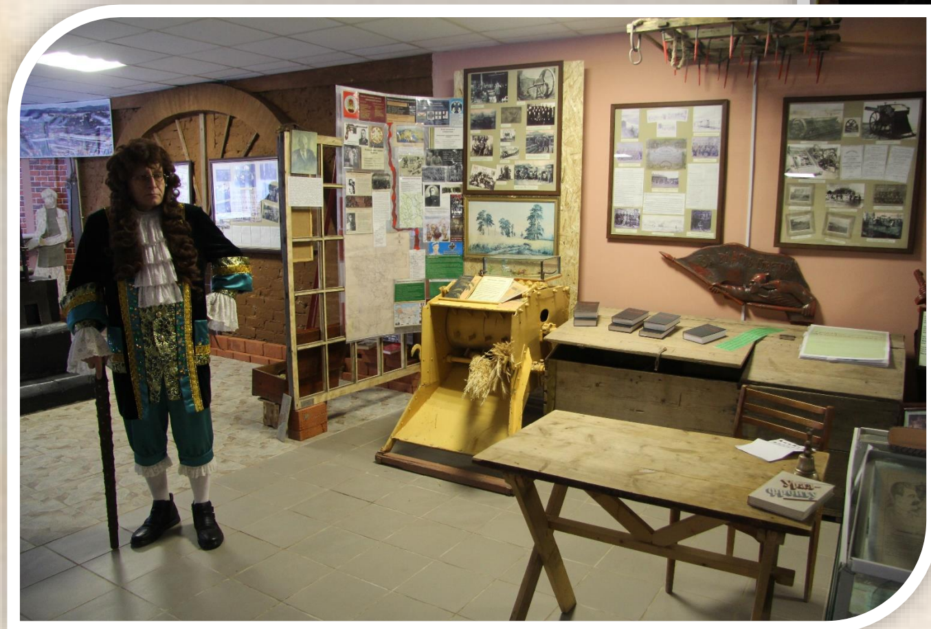
Граф А. С. Строганов в музее