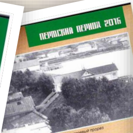
Вид завода на перемычке