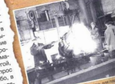
Ленточный конвейер – пель для