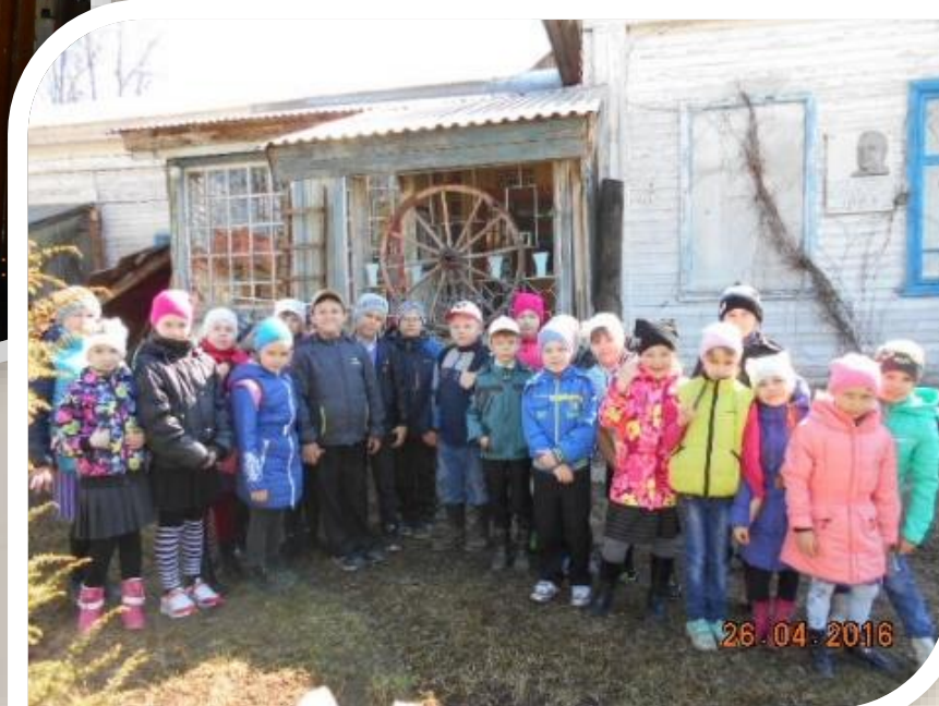
Группа д/сада после экскурсии