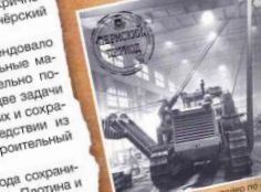
Сверловый стан. Комаров