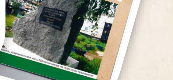
Мемориал, установленный в честь 250-летия завода на территории предприятия