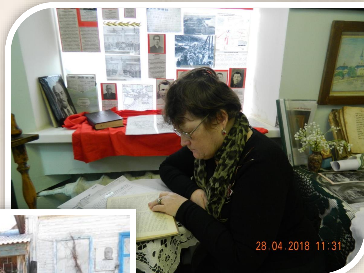
Поиск ответов на вопросы конкурса